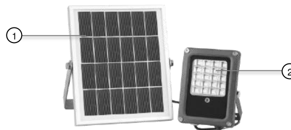
1 Panneau solaire 2 Projecteur