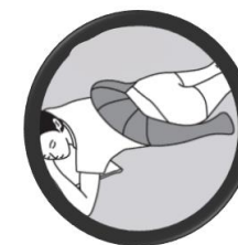
Bas du dos