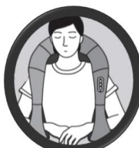
Cou / épaules