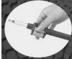
Bit-Satz drehen, um Bit auszuwählen