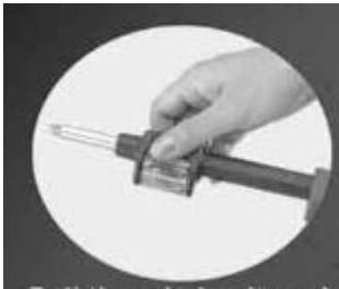
Griff nach hinten ziehen