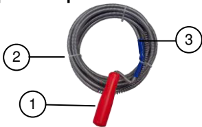
1. Manivelle 2. Flexible 3. Foret