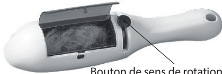
Bouton de sens de rotation

La brosse est pourvue d'un bouton de sens de rotation. Il vous permet de choisir le sens dans lequel la brosse doit tourner.