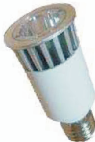
PE-5382 - Sockel E 14