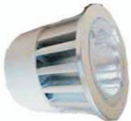
PE-5378 - Sockel GU 5.3