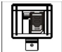
Insérer la carte SIM

Pour insérer la batterie, ouvrez le cache du logement prévu pour la batterie, et glissez la batterie dans le renforcement. Branchez le câble dans la prise prévue à cet effet.