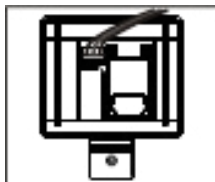
Insérer la batterie