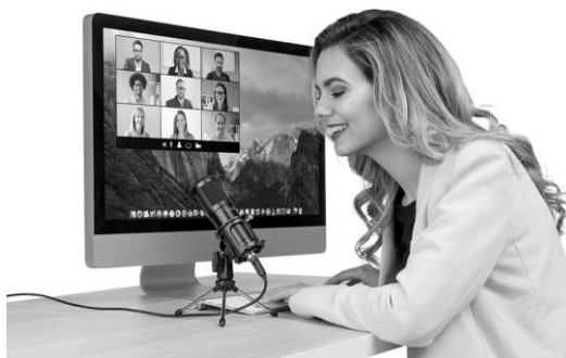
Abb. 1: Mikrofon platzieren und ausrichten

Klappen Sie das Mini-Stativ auseinander und platzieren Sie es auf einer ebenen Oberfläche. Schieben Sie das Mikrofon in die Halterung. Achten Sie darauf, dass der On/Off-Schalter (ZX-1692) nach oben zeigt.