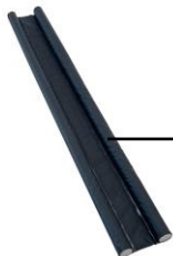
1. Boudin isolant